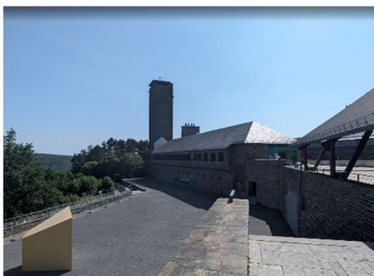
Abbildung 5: Ordensburg Vogelsang

Eine weitere Exkursion hatte die Ordensburg Vogelsang zum Ziel. Im Gegensatz zu dem vorherigen Rundgang, wurde hier eine Stätte der Täter besucht: In Vogelsang wurden Führungskader des Nationalsozialismus auf ihre Aufgaben innerhalb dieses verbrecherischen Regimes vorbereitet. Im Klartext: Hier wurden Mörder ausgebildet! Auch hier begleitete uns Herr Körfer, dem unser besonderer Dank für seine Unterstützung und sein Engagement und seine Expertise gilt.