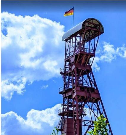
Abbildung 2: Zeche Sophia Jacoba, Hückelhoven